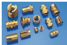
FISSAGGI PER MATERIE PLASTICHE FASTENERS FOR PLASTICS