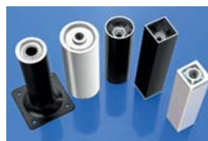
INSERTI PER TUBI INSERTS FOR TUBES