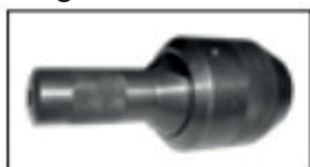
Testa / Head

A seconda del diametro del rivetto e del materiale si dovranno richiedere testina, mandrino e molla. Depending on the diameter and material of the rivet head, mandrel and spring must be requested.