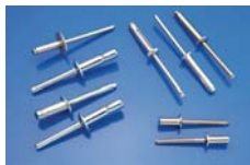
RIVETTI A STRAPPO BLIND RIVETS