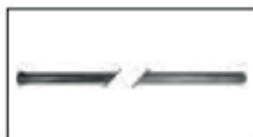
Mandrino / Mandrel