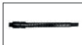
Molla / Spring