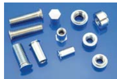
AUTOFISSANTI SELF-CLINCHING FASTENERS