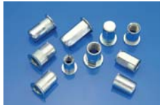
INSERTI FILETTATI THREADED INSERTS