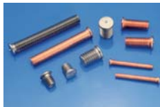
PERNI A SALDARE WELDING STUDS