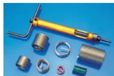
FILETTI RIPORTATI WIRE INSERTS