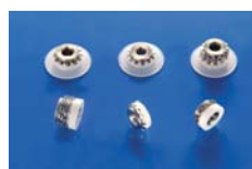
INSERTI PER PIETRE E SUPERFICI SOLIDE INSERTS FOR STONES AND SOLID SURFACES