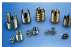
BUSSOLE AUTOFILETTANTI E SPECIALI SELF-TAPPING AND SPECIAL THREADED INSERTS