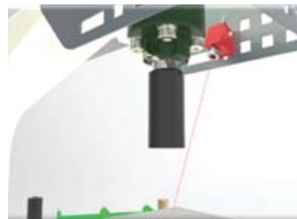
Puntatore laser. / Laser pointer.