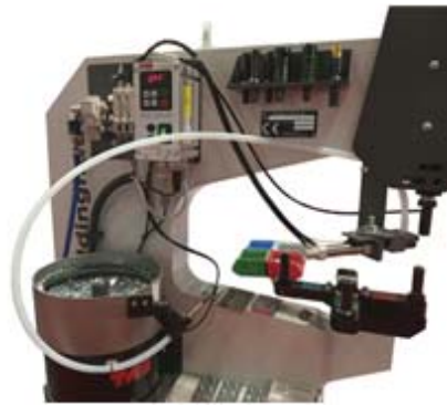
Sistema di alimentazione automatico multiplo. / Automatic multi-feeder system.